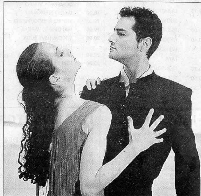
Carmen e Don Jose' interpretati dalla compagnia "Gato Blanco"