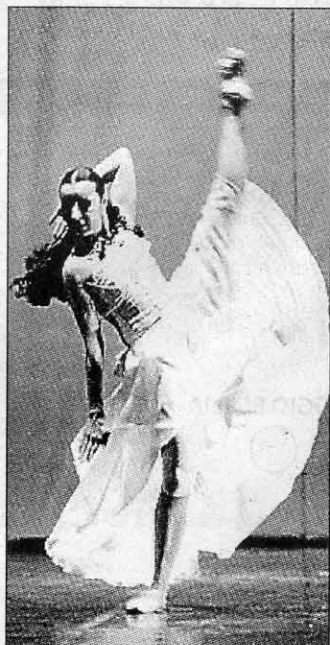
Carmen e Don Jose' interpretati della Compagnia Bami-Guyon

L'incontro decisivo e' avvenuto in modo del tutto casuale lo scorso novembre, quando per